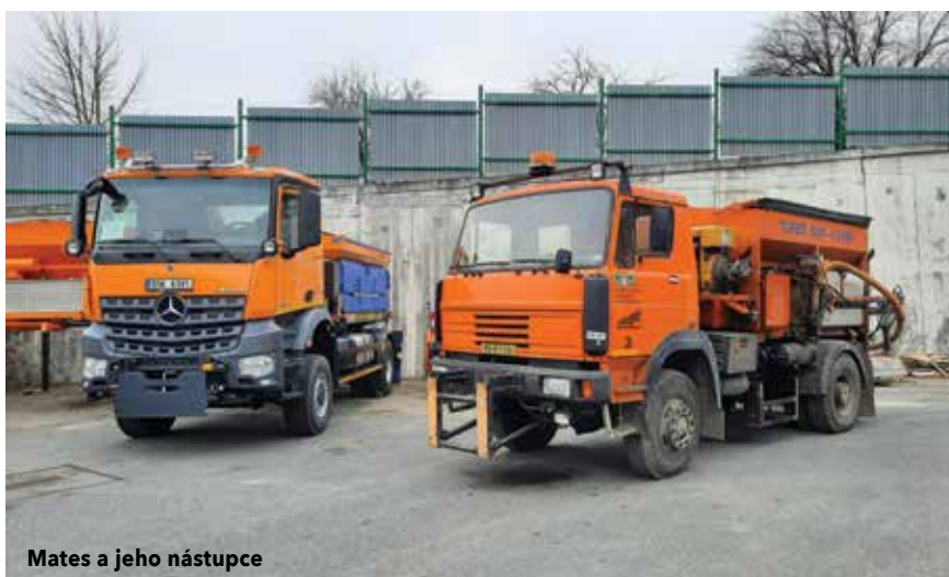
Mates a jeho nástupce