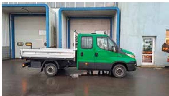
■ Iveco Daily třístranný sklápěč pro středisko 14