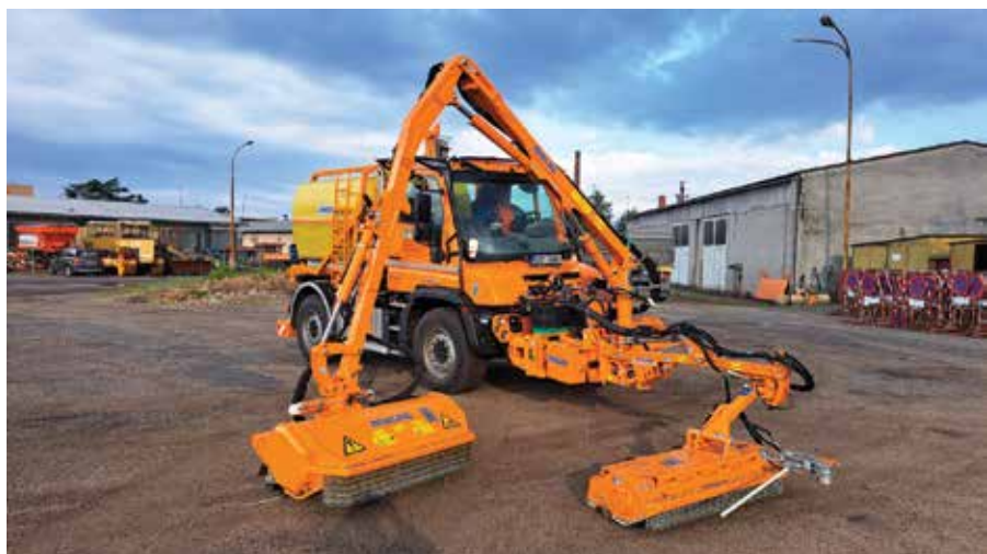
■ Sekačku Mulag MKM 700 - jde o dvouramennou sekačku, kdy jedno rameno je automatické polosvodidlové, druhé je pak poloautomatické s dosahem 7,2 metru. Na rameno je k dispozici i pařezová fréza. Stejně jako v případě níže zmíněné cisternové nástavby jde o nástavbu pro vůz Unimog.