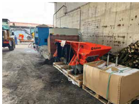
■ Lžiči na doplnění krajnic Finliner Optimas