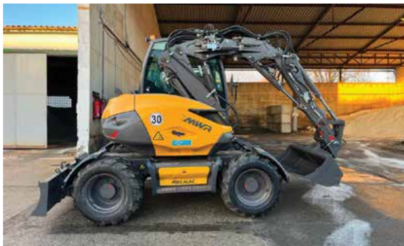
■ Dlouhodobě jsme si najali i sedmitunový kolový bagr Mecelac 7MWR, který má svahovou lžiči.