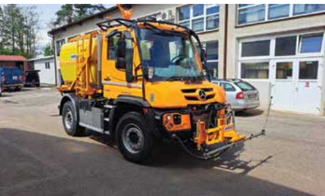
■ Unimog U 427 K - to je multifunkční vůz, který při údržbě zastane hodně práce.